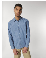
Stanley Innovates Denim