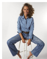
Stella Inspires Denim