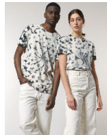
Creator Tie and Dye