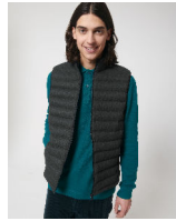
Stanley Climber Wool-Like

Shell : Plain Weave Brushed , 100% Gerecycled polyester , Fluorine-free DWR , 140 GSM