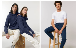
Cruiser Denim Stanley Stepper Denim