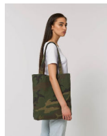
Tote Bag AOP