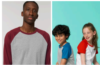
Catcher Long Sleeve Mini Catcher Short Sleeve