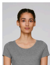
Stella Loves Modal