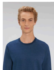
Stanley Stroller Denim