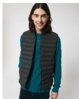
Stanley Climber Wool-Like

Shell : Plain Weave Brushed , 100% poliestere riciclato , Fluorine-free DWR , 140 GSM