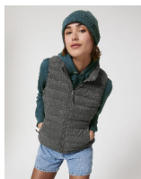
Stella Climber Wool-Like

Shell : Plain Weave Brushed , 100% poliestere riciclato , Fluorine-free DWR , 140 GSM