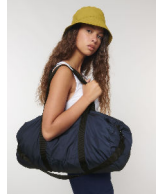
Lightweight Duffle Bag

Shell : Plain Weave , 100% poliestere riciclato , Fluorine-free DWR , 75 GSM