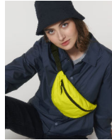
Lightweight Hip Bag

Shell : Plain Weave , 100% poliestere riciclato , Fluorine-free DWR , 75 GSM