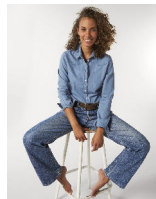
Stella Inspires Denim

Shell : Denim tissé , 100% coton biologique filé et peigné , Pièce lavée , Yarn Dyed , 170 GSM