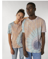
Creator Tie and Dye