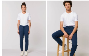
Stella Tracer Denim Stanley Stepper Denim