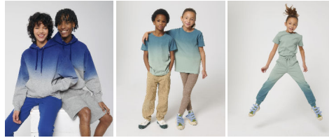
Slammer Dip Dye