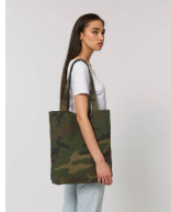
Tote Bag AOP

Shell : Toile , 80% coton recyclé , 20% polyester recyclé , 300 GSM