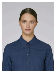
Stella Inspires Denim