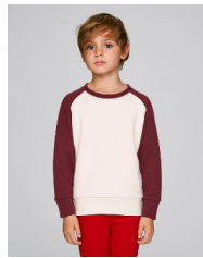
Mini Scouts Contrast