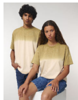
Fuser Aged Dip Dye

Shell : Terry , 100% gekämmte ringgesponnene Bio-Baumwolle , Am Stück vorgewaschen , Am Stück gefärbt , 350 GSM