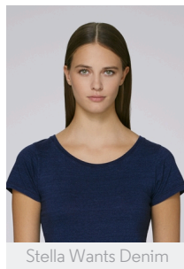
Stella Wants Denim