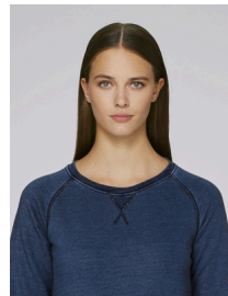
Stella Trips Denim