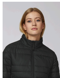
Stella Walks Long Sleeve