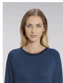
Stella Tripster Denim