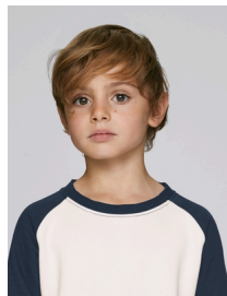
Mini Scouts Contrast